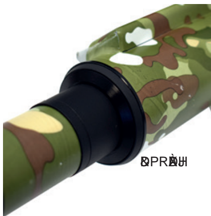
CUSTOM GRAPHICS BS-O-087